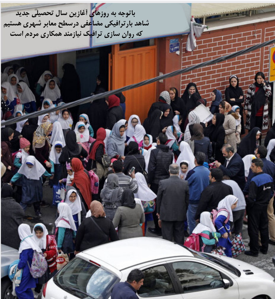
رئیس پلیس راهور البرز: