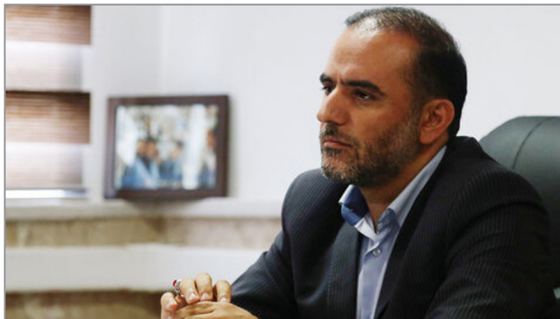
عضو شورای اسلامی شهر کرج با تاکید بر اهمیت رفع سد معبر در سطح شهر با هدف تسهیل در تردد شهروندان و کسب رضایت آنان، گفت: مافیای سد معبر در حال توسعه و اقدامی برای رفع آن صورت نگرفته است.

عضو شورای اسلامی شهر کرج تاکید کرد: مدیران مناطق موظف هستند ظرف دو هفته، منطقه خود را از عوامل سد معبر پاکسازی کنند در غیر این صورت به وضوح آنچه فی مابین سد معابر کنندگان و برخی عوامل خدمات شهری صورت می‌گیرد را بیان خواهیم کرد.