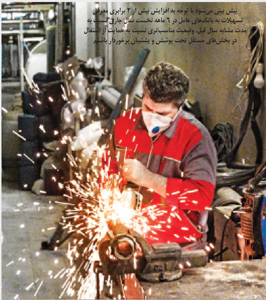
مدیرکل تعاون، کار و رفاه اجتماعی استان البرز: