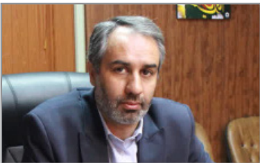
قانونی ندارد. اکنون بیش از ۱۲۰ هزار واحد صنفی و خدماتی در استان البرز فعالیت می‌کنند که بخشی از این واحدها فاقد پروانه کسب هستند.

رئیس اتاق اصناف مرکز البرز گفت که در اجرای ویژه نظارت بر بازار، پرونده ۱۰۷ واحد صنفی متخلف به تعزیرات حکومتی این استان ارجاع شد.