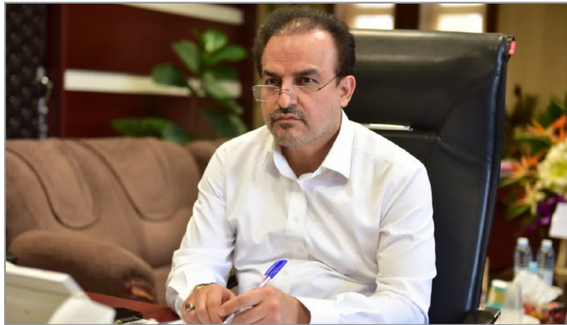
سرپرست معاونت هماهنگی امور اقتصادی استانداری البرز با اشاره به برگزاری همایش نان کامل نان سالم، دستور پیگیری و نظارت جدی بر عملکرد نانوایی‌ها را به فرمانداری‌های شهرستان‌های استان صادر کرد.

وی افزود: نظارت دقیق و کارشناسانه بر نانوایی‌ها، نظارت دقیق بر نحوه تخصیص سهمیه آرد متناسب با نیاز منطقه و نحوه کارکرد نانوایی‌ها و اجرای دقیق دستورالعمل درباره اعطای سهمیه نانوایی در دستور کار متولیان امر قرار گیرد. گفتنی است در این کارگروه پیشنهادی به منظور جلوگیری از قاچاق آرد، دریافت کد شناسه کالا برای کیسه‌های آرد با استفاده از زیرساخت‌های نرم‌افزاری جهت ممانعت خروج از شبکه آرد مطرح و مقرر شد مطالعات کارشناسی و تخصصی جهت بررسی طرح توسط فرمانداری‌های شهرستان‌های استان انجام و در صورت تصمیم بر نتیجه بخش بودن موضوع در جلسه بعدی کارگروه مصوب و اقدام شود.