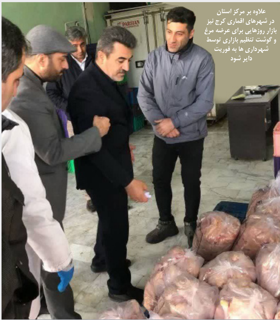
علاوه بر مرکز استان در شهرهای اقماری کرج نیز بازار روزهایی برای عرضه مرغ و گوشت تنظیم بازاری توسط شهرداری‌ها به فوریت دایر شود

استفاده از هوش مصنوعی می‌تواند موجب کاهش آلاینده‌گی شود