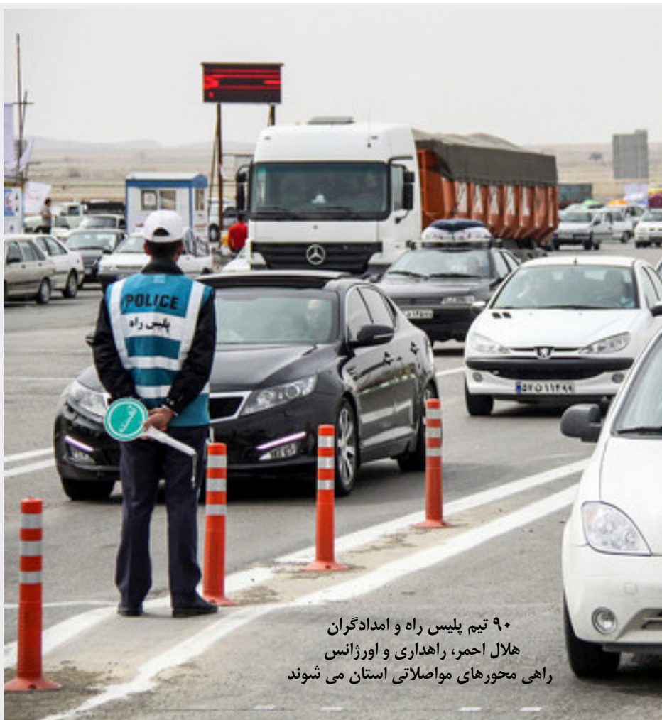
۹۰ تیم پلیس راه و امدادگران هلال احمر، راهداری و اورژانس راهی محورهای مواصلاتی استان می شوند