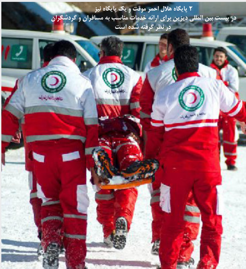
فرماندار کرج خبر داد: