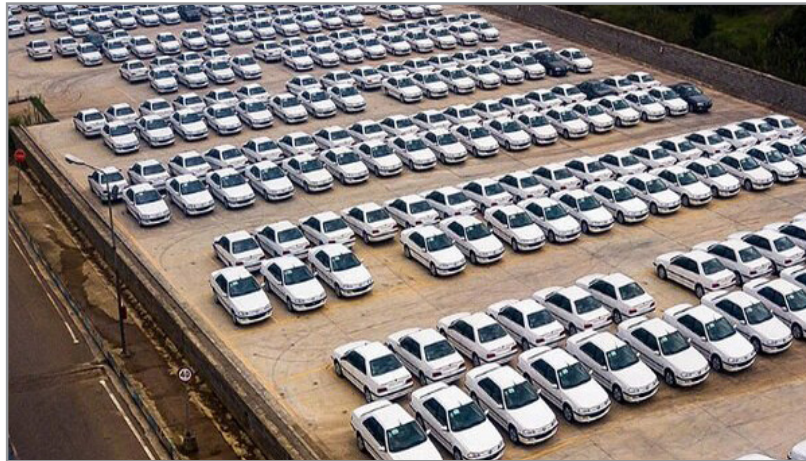
وزیر صنعت اعلام کرد: خودروساز موظف است که طبق قانون عمل کند و اگر خودروساز به تعهدات خود عمل نکند، موضع وزارت صمت حمایت از مصرف کننده است و خودروساز متخلف را به قوه قضائیه معرفی می کند.

وی افزود: اگر خودروسازی می خواهد قرارداد را کنار بگذارد و خودروی جایگزین ارائه کند، این موضوع باید با توافق طرفین باشد و در غیر این صورت از مشتری حمایت می کنیم. درباره خودروی تارا ۵ هم که در این جلسه گفته شد با تغییر گیربکس افزایش قیمت بیش از ۱۹۰ میلیون تومانی داشته و مشتری هم وادار به خرید محصول ارتقا یافته شده، بررسی های لازم انجام خواهد شد و اگر خودروساز به تعهد خود عمل نکرده باشد، از مصرف کننده حمایت خواهیم کرد.