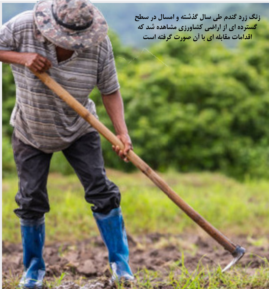
زنگ زرد گندم طی سال گذشته و امسال در سطح گسترده ای از اراضی کشاورزی مشاهده شد که اقدامات مقابله ای با آن صورت گرفته است

سید مجید میر احمدی رئیس کمیته ستاد امنیت انتخابات کشور در حاشیه اولین روز ثبت نام از نامزدهای چهاردهمین انتخابات ریاست جمهوری در جمع خبرنگاران گفت: به میزانی که آمادگی زیرساختی در کشور فراهم شده است، امکان برگزاری انتخابات به صورت الکترونیک فراهم شده است. وی با بیان اینکه در زمینه